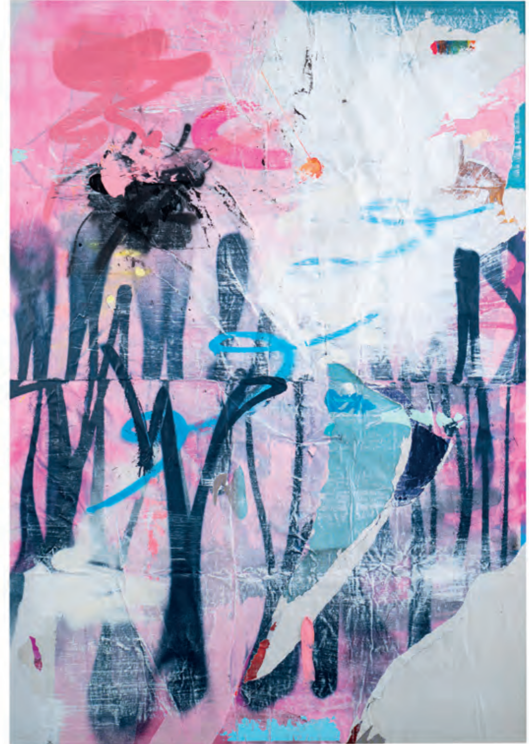
Unnecessary roughness / And again, harm got his way. Like he does. Always.

ca. 120x170 cm acrylics, spraypaint and paper on honeycomb cardboard 2023