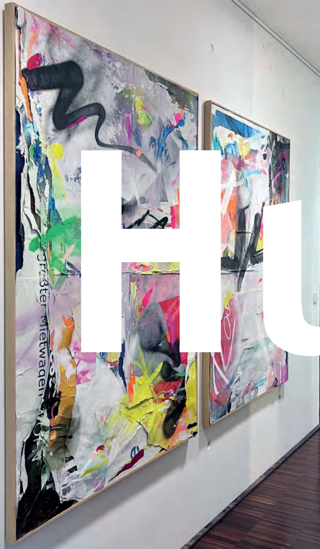
The revolution will not be supervised / Rau(s)ch 120 x 170 cm; corporate collection 2023