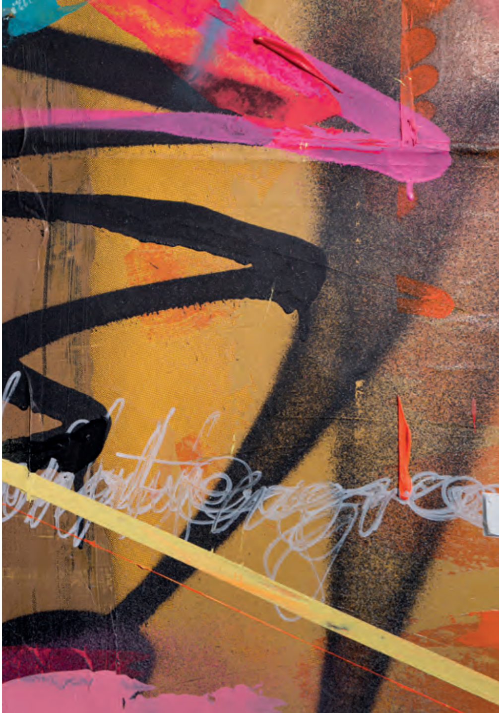
Latissimus stultitiam / It's over when it's over, folks

ca. 120x135 cm acrylics, spraypaint and paper on honeycomb cardboard 2023